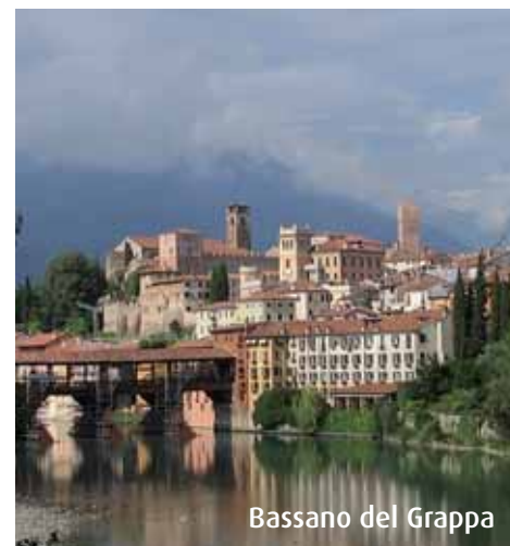
Bassano del Grappa

Per informazioni e prenotazioni: Agenzia Bluvacanze, tel. 02.45.71.22.54.