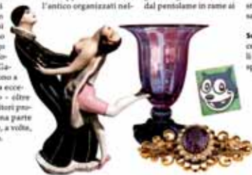
Da sinistra: statua in avorio "Fante" (1940), con in vetro di Murano (1950) da La Chiesetta, portafogli in bachelite degli anni '20 da Terzo, spilla con ametista sul banco di Gioia.

Scacchi cinesi in avorio, ceramiche, bronzi e mobili sono da ammirare nello spazio espositivo di Arte