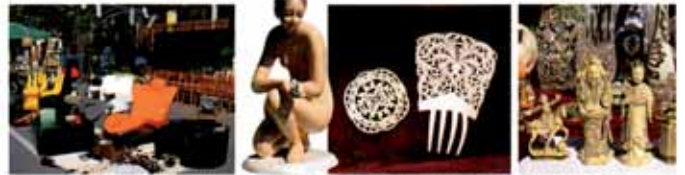
Da sinistra: anelli dal design anni '60 da Carmine Ceramica da Ciro, spilla e fermaglio primi '900 da Terzo, scacchi cinesi in avorio da Terzo. Qui sotto: anello con corallo di Sciacca (1920) da Gioia. Nella pagina accanto: mappe di Buccinasco e dintorni.